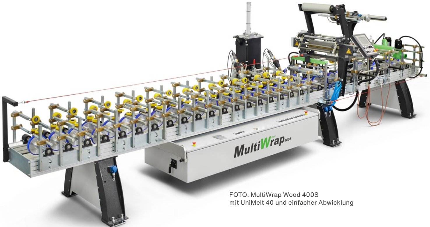
FOTO: MultiWrap Wood 400S mit UniMelt 40 und einfacher Abwicklung